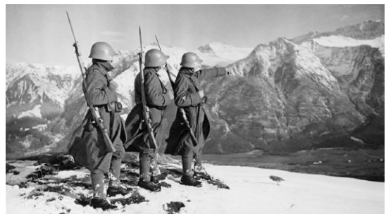
Patrouille frontalière suisse dans les Alpes pendant la Seconde Guerre mondiale. DR.