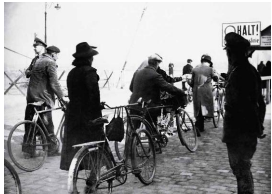
Franchissement de la frontière entre zone occupée et zone libre à Moulins.

Autour de cette présentation, en collaboration avec nos différents partenaires, sont organisées des rencontres, ateliers pédagogiques, discussions.